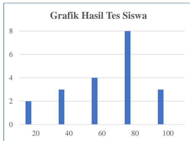
Gambar 1. Grafik hasil tes siswa

Langkah awal yang dilakukan dalam penelitian ini adalah menentukan subjek sebanyak 20 orang dengan mengisi kuesioner online. Tes dilakukan pada tanggal 11 November di kelas XI IPA 4. Sebanyak sepuluh soal pilihan ganda diberikan kepada siswa. Adapun hasil analisisnya disajikan dalam gambar berikut: